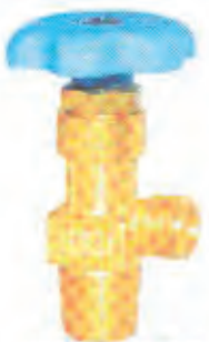
活瓣式氧气瓶阀 Movable Flap Type