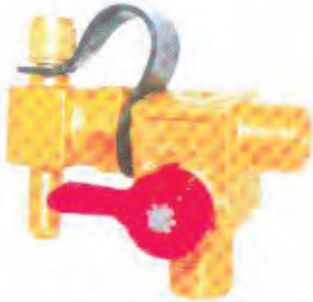
压缩天然气充气阀 CNG Refilling Valve