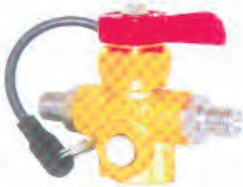
压缩天然气充气阀 CNG Refilling Valve