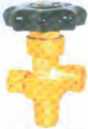
活瓣式氧气瓶阀 Movable Flap Type