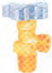
轴联式氧气瓶阀 Axial Connection Type