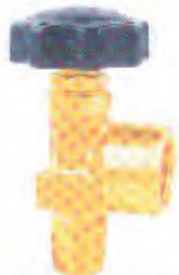
活瓣式氧气瓶阀 Movable Flap Type