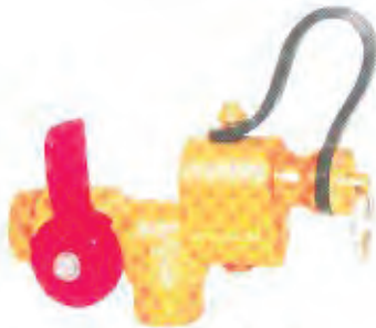
压缩天然气充气阀 CNG Refilling Valve