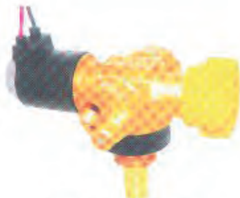
车用压缩天然气电磁阀 CNG Cylinder Valve